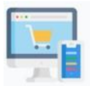
Visitar tiendas on line