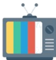
TV abierta o de paga