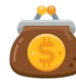
Retribuyen un beneficio directo al monedero