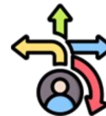
Pueda elegir entre varias promociones con diferentes beneficios.