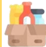
Más cantidad de producto