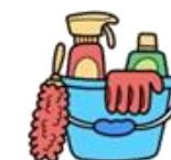
Limpieza del hogar