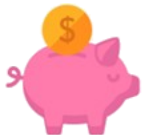
Beneficios económicos/ ahorro