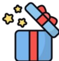
Los premios que ofrece