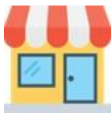
Visitar tiendas físicas