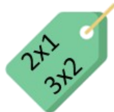
"2X1, 3X2" El formato más atractivo para participar