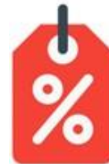
"Descuentos" es el formato más conocido