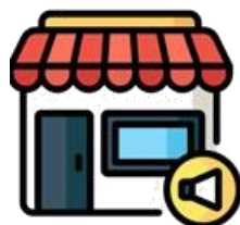
Publicidad en la tiendas o puntos físicos