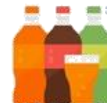
Bebidas no alcohólicas