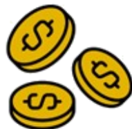
Costo de la promoción